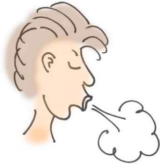
Entgiftung durch Atemtechnik