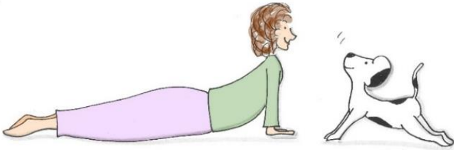
Yoga-Asanas für gute Vorsätze